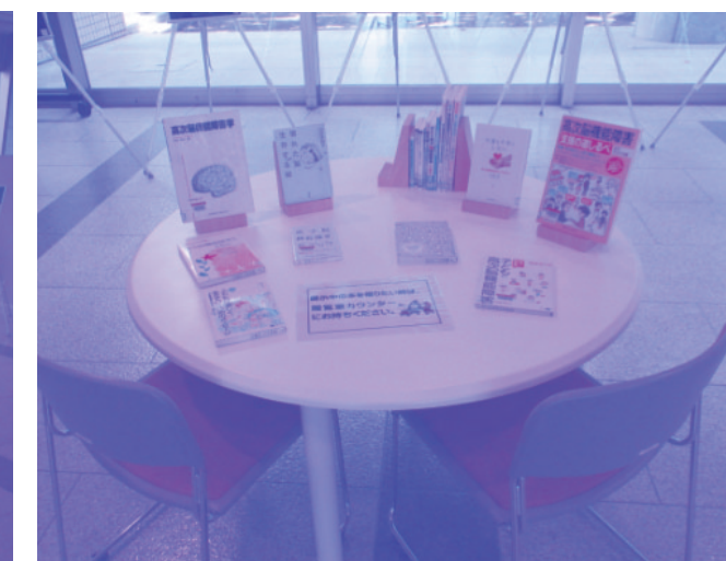
(宮崎県立図書館でのパネル展示R5. 7.20～7.30)

高次脳機能障がいについて知っていただくため、 県内の下記、公共図書館において、パネル展示を開催します。